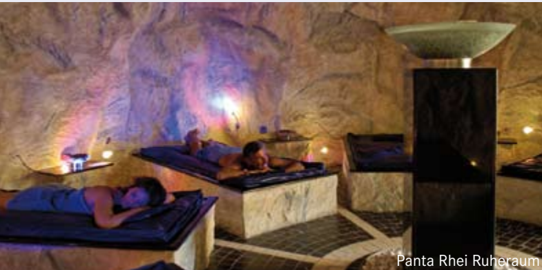
Panta Rhei Ruheraum