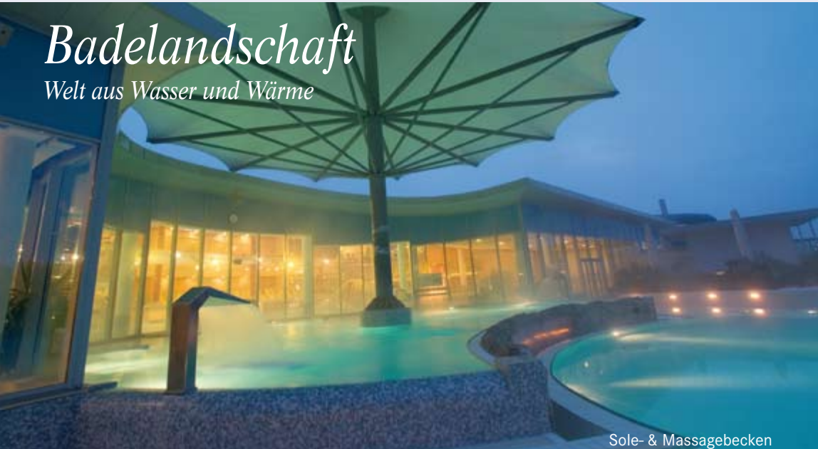
Sole- & Massagebecken