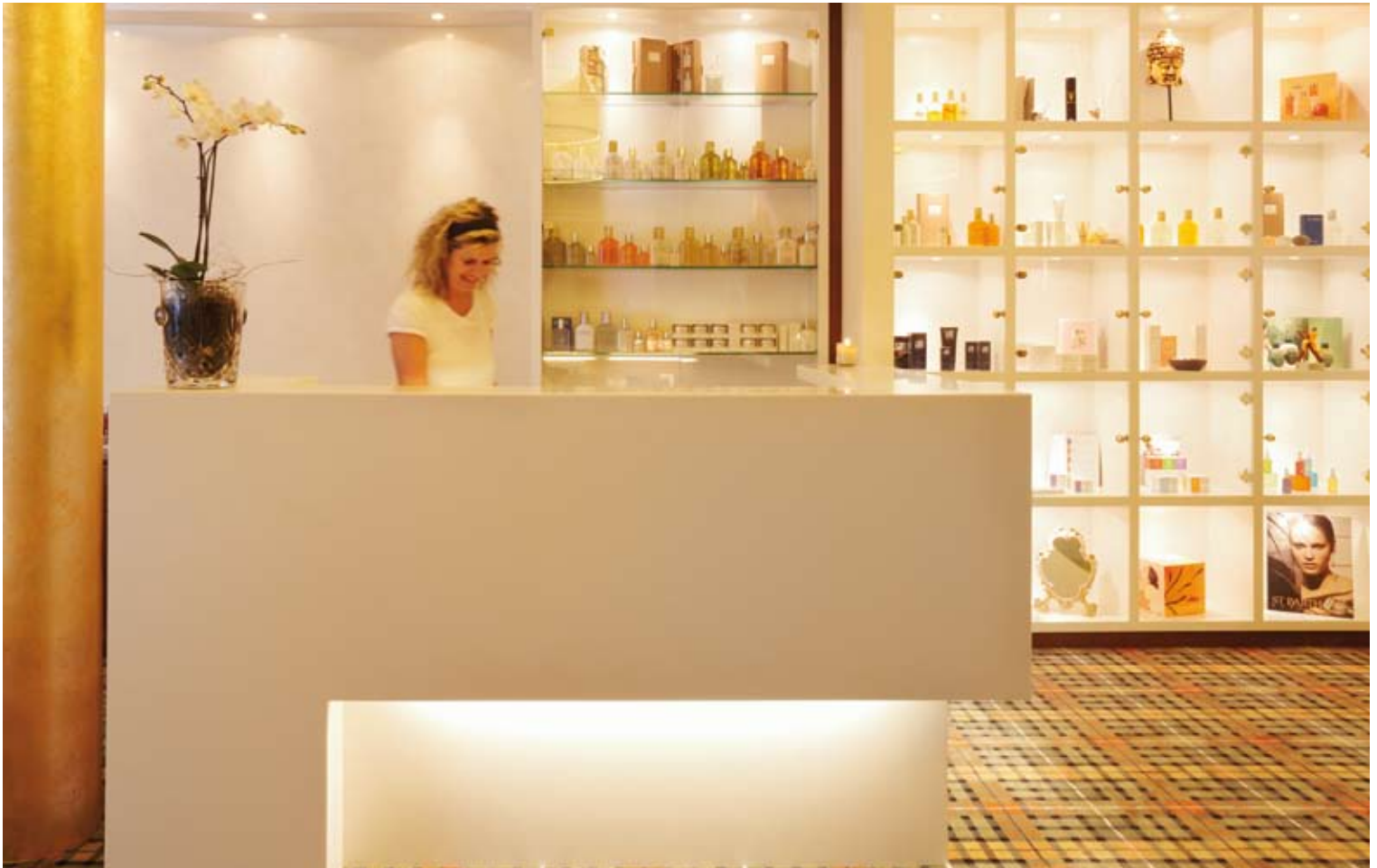
Wellness-Rezeption – Luxus und Behaglichkeit