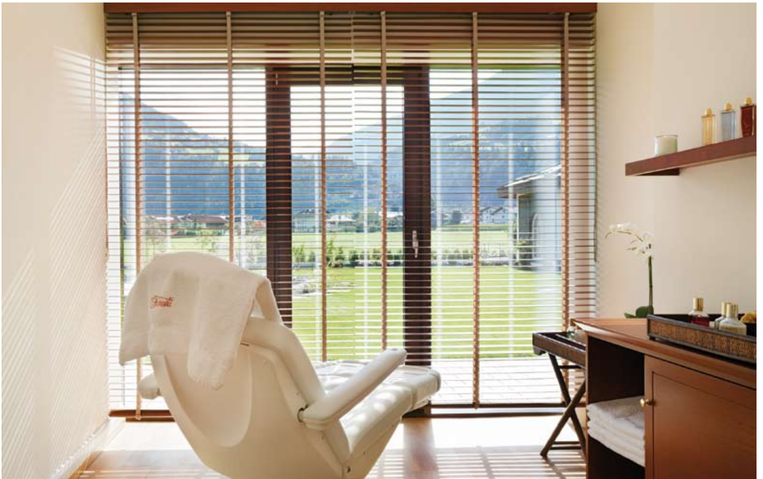
Behandlungsräume mit Blick in den Naturpark der Zillertaler Alpen