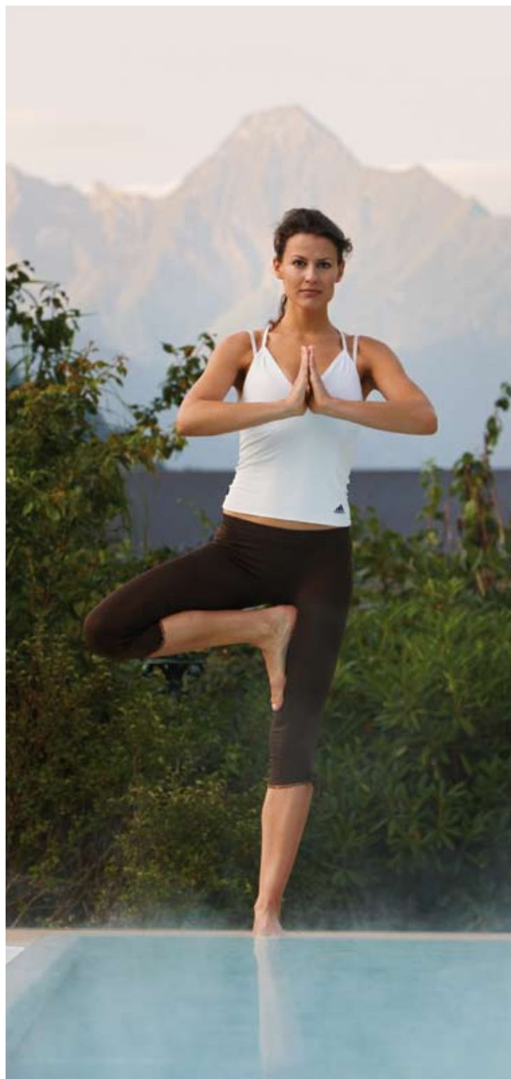
Balance finden in unserem Outdoor-Fitnessbereich