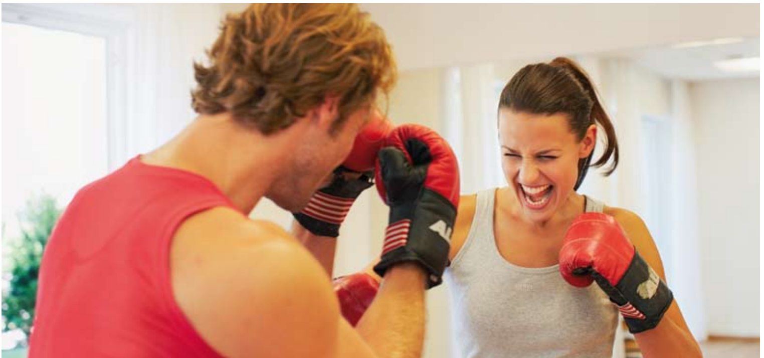
Auf 160 m 2 Kraft tanken. Im neuem Indoor- & Outdoor - Gymnastik- und Entspannungsraum