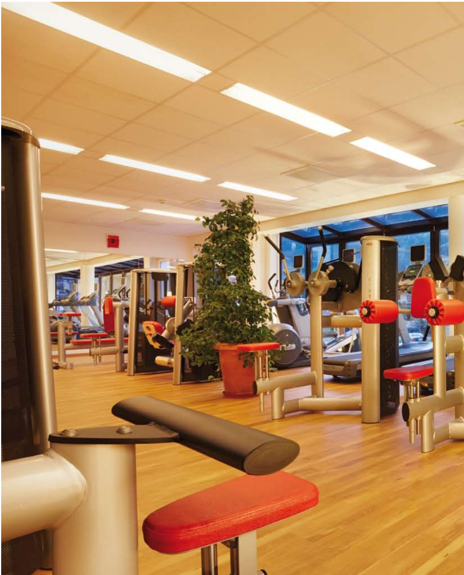
Lichtdurchflutetes Fitness-Studio mit 160 m 2 – alle kardiologischen Geräte mit SAT-TV, MP3-Player und DVD.