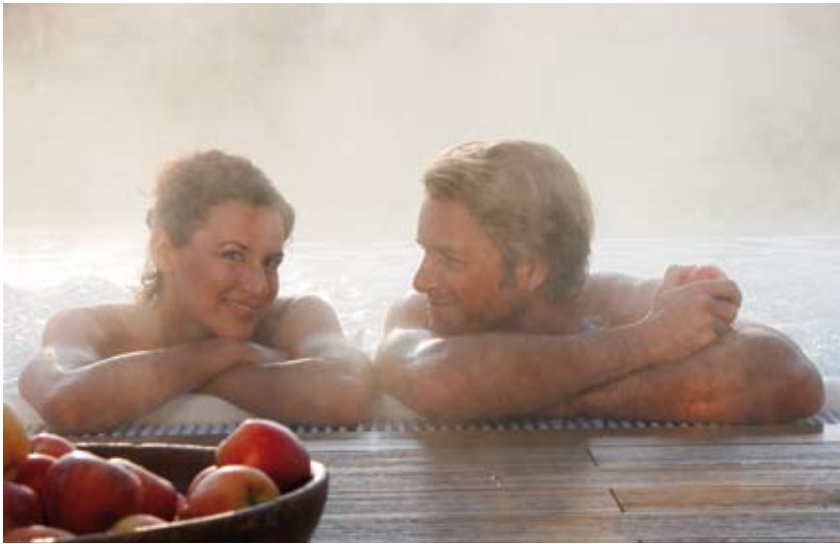
Der neue Solepool 34°C im Garten mit Blick in die Berge