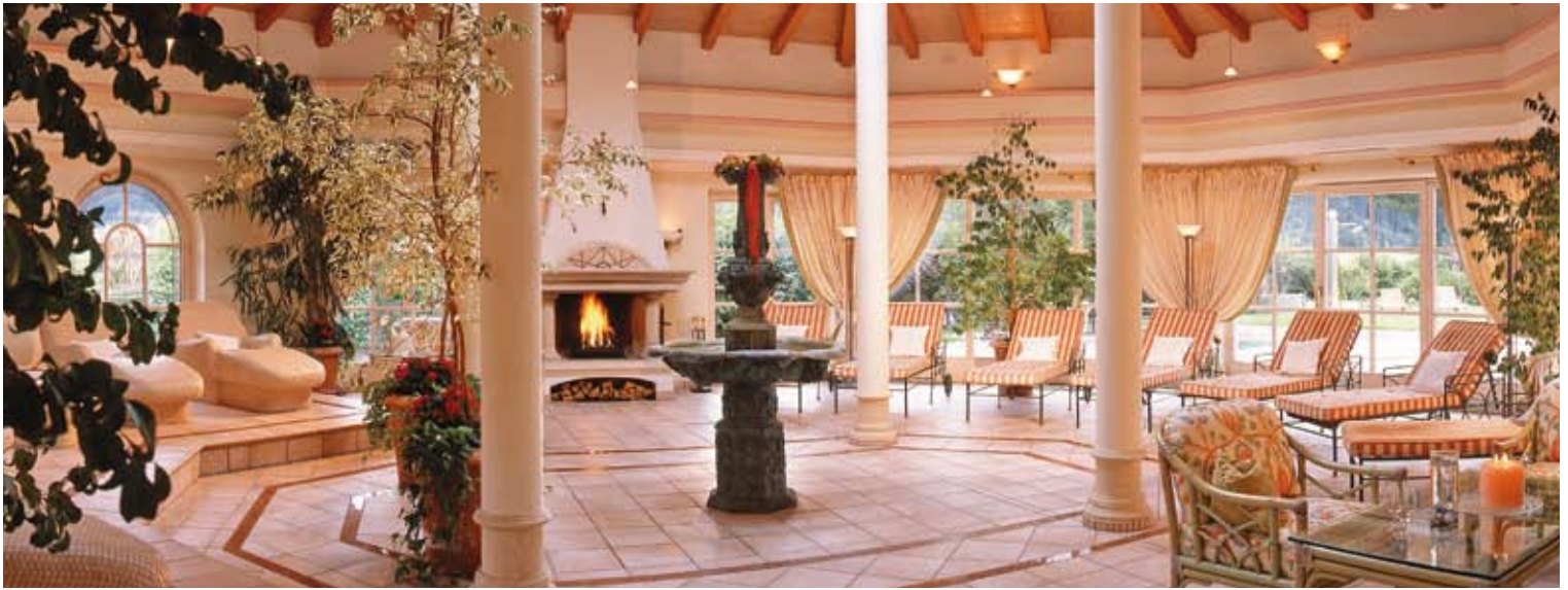
Sonnenhaus – wohliges Ambiente zum Entspannen