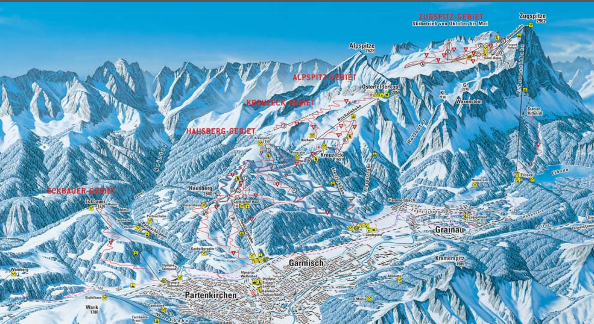
Garmisch-Partenkirchen – Skigebiete Eckbauer, Classic und Zugspitze