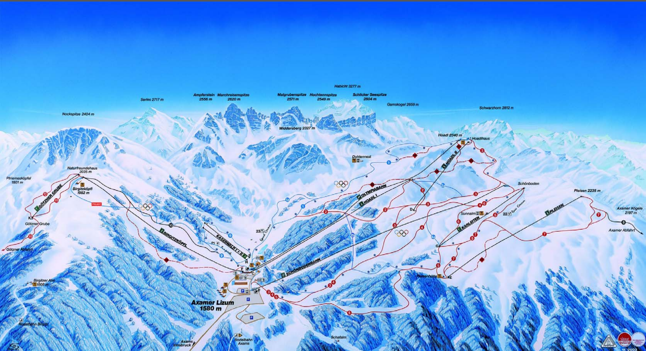
Axams (Österreich) – Skigebiet Axamer Lizum