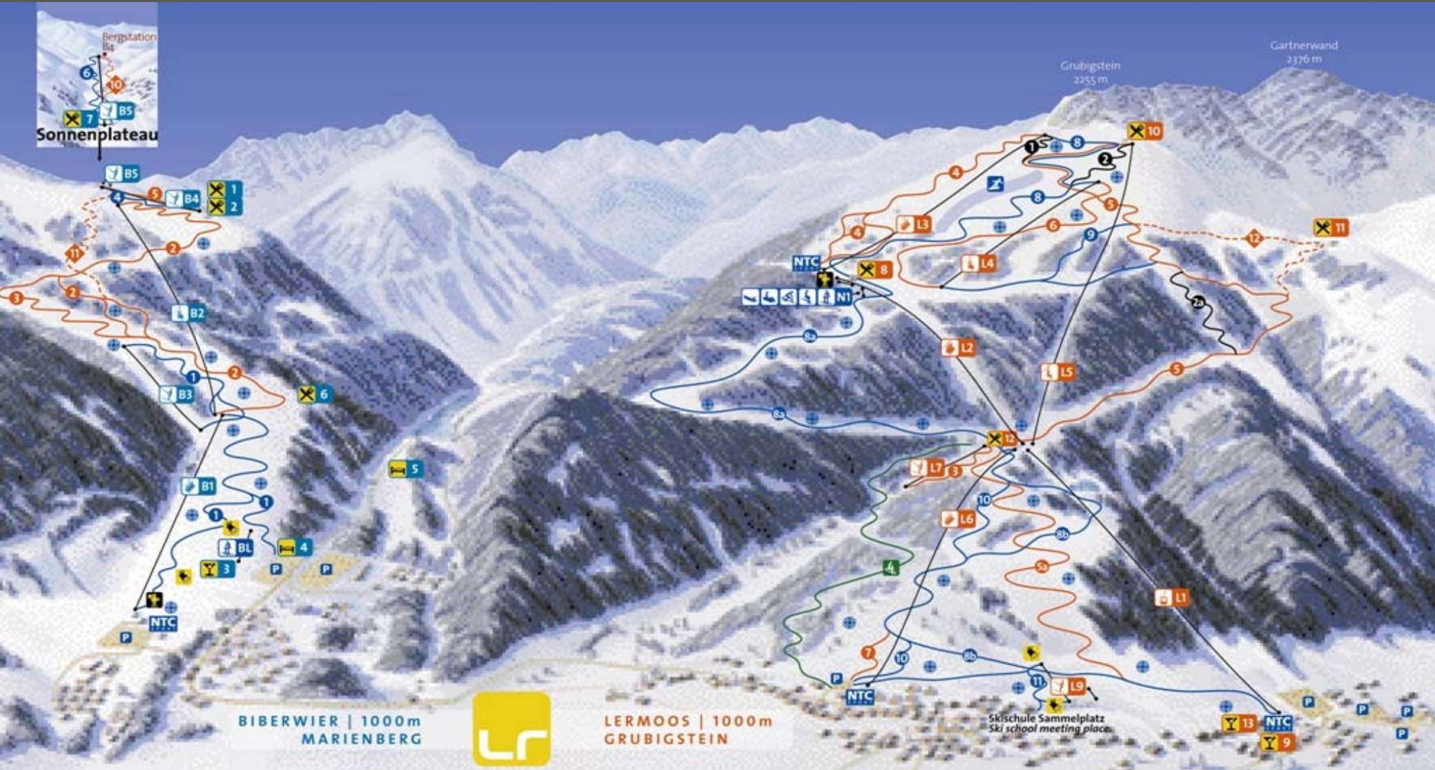
Biberwier-Lermoos (Österreich) – Skigebiete Marienberg und Grubigstein