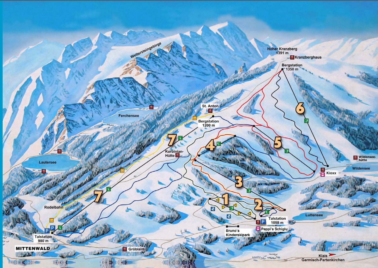
Mittenwald – Skigebiet Kranzberg-Luttensee