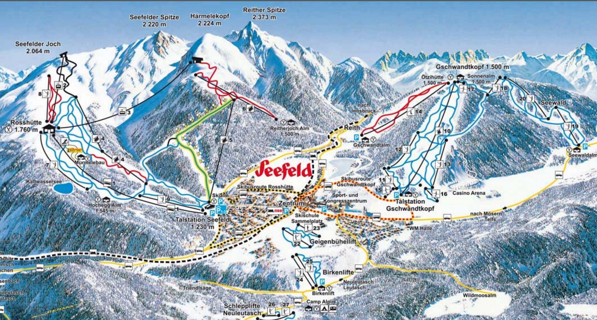
Seefeld (Österreich) – Skigebiete Rosshütte und Gschwandtkopf