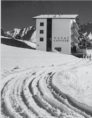
Erster Winter des Cervosa