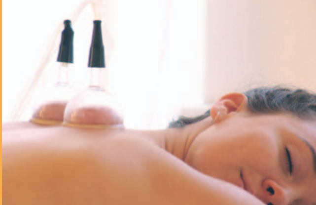
Piroche bioenergetische Rückenmassage