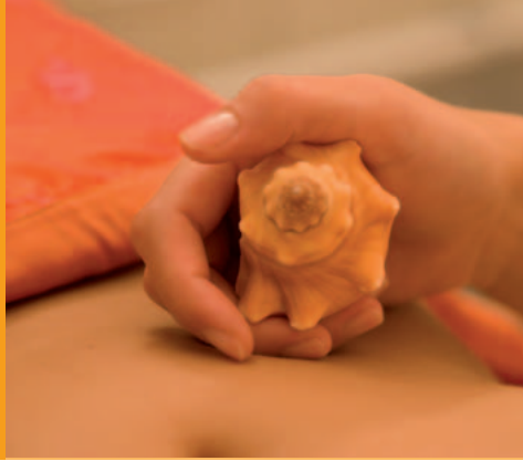
Lomi Lomi Nui